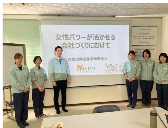
2023年春の社長へのプレゼン

現在、経営層の変革推進をベースに、各部署より合計5名のメンバーを選び、月に1回女性活躍推進委員会を開いている。準備段階として、2023年春の社長へのプレゼンでは、「女性パワーが活かせる会社づくりにむけて」と題し、①女性社員の能力開発 ②上層部の意識改革 ③コミュニケーションの3本柱で提案を行った。その実現・拡大に向けて、研修セミナーの企画運営、女性社員の交流を深める「女性社員交流会」等、女性社員起案の取組みを協力して進めている。