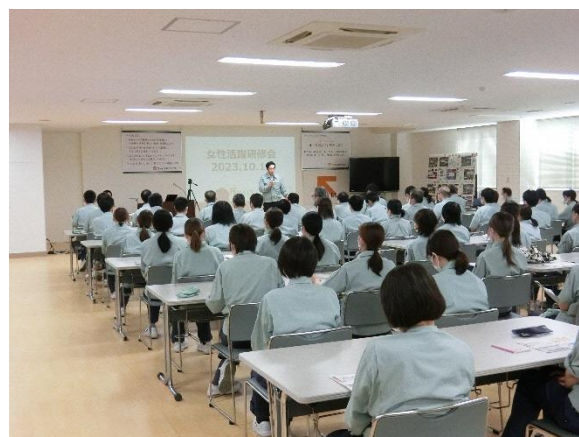
『女性の健康とキャリア』をテーマとした研修